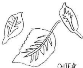
葉の落ち方を観察しようと思う日々

見る、聞く、触れる、感じるなど、さまざまな体験を積み重ねることで、気づけることも想像できることも増えて、目の前の風景さえも変わっていくんだなあと思います。今だからこそ、日々の中で疎かになってしまいがちな目の前の風景について、一つひとつ丁寧に感じていけたらいいなあと思ったのでした。