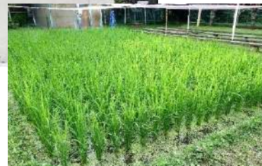
●校内には水田もある