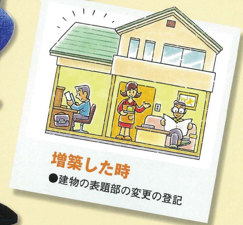
増築した時 ●建物の表題部の変更の登記