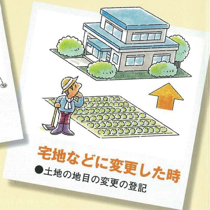
宅地などに変更した時 ●土地の地目の変更の登記