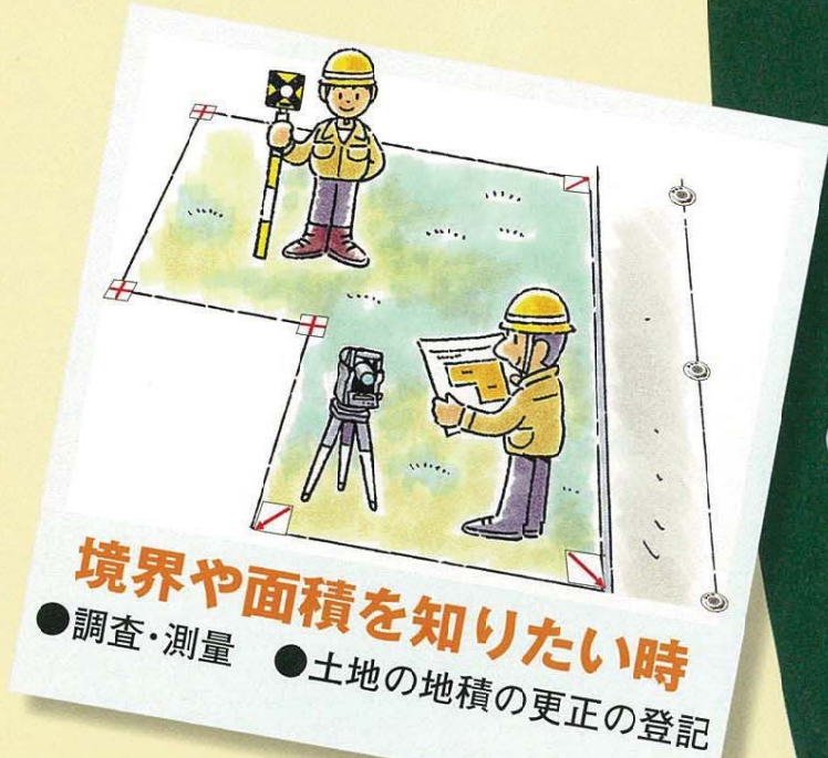
境界や面積を知りたい時 ●調査・測量 ●土地の地積の更正の登記