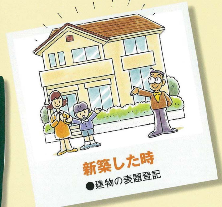
新築した時 ●建物の表題登記