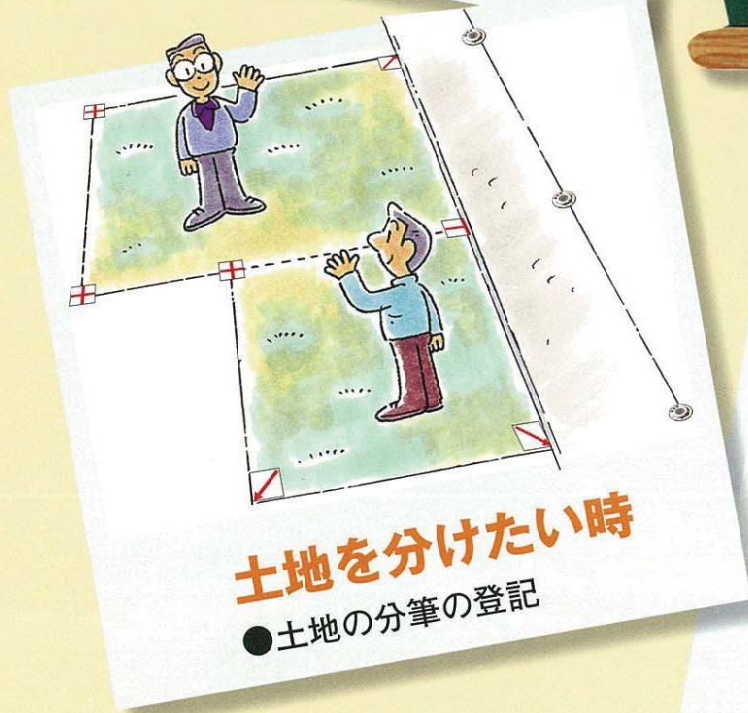
土地を分けたい時 ●土地の分筆の登記