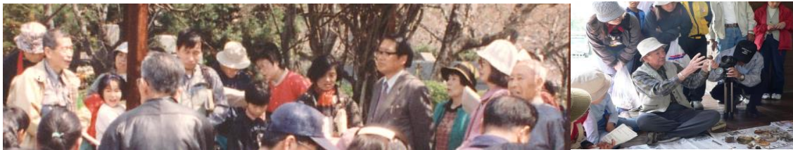
第3代三島会長・顧問